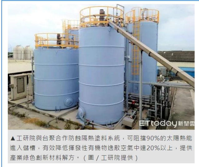
▲工研院與台聚合作防蝕隔熱塗料系統，可阻擋90%的太陽熱能進入儲槽，有效降低揮發性有機物逸散空氣中達20%以上，提供產業綠色創新材料解方。

業化，目前已在高雄林園工業區、雲林麥寮地區完成多個大型化學儲槽的塗裝驗證，提供產業綠色創新材料解方。