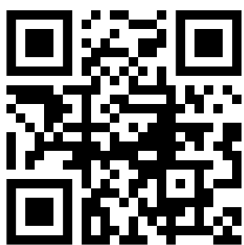
台聚 CSR 專區