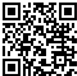
台聚 CSR 粉絲頁