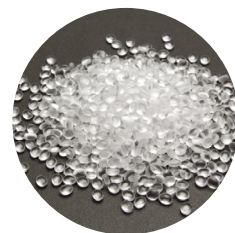
線型低密度聚乙烯樹脂 Linear Low Density Polyethylene 簡稱 LLDPE