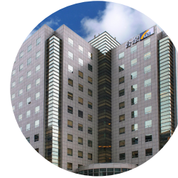
① 台北總部 台北市內湖區基湖路 37 號 12 樓