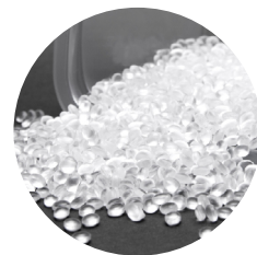
高密度聚乙烯樹脂 High Density Polyethylene 簡稱 HDPE