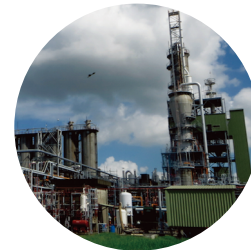
③ 高雄總公司 高雄市仁武區後安里鳳仁路 330 號