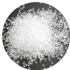
乙烯醋酸乙烯酯共聚樹脂 Ethylene Vinyl Acetate Copolymer 簡稱 EVA