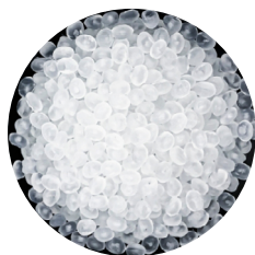
低密度聚乙烯樹脂 Low Density Polyethylene 簡稱 LDPE